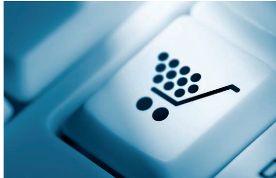
Online-Handel beschäftigt die Gerichte

In zwei jüngst vom BGH entschiedenen Fällen hatten die Verkäufer nach entsprechender Rückbelastung ihres PayPal-Kontos den jeweiligen Käufer auf erneute Zahlung des Kaufpreises verklagt. Fraglich war insoweit, ob der Kaufpreisanspruch mit der zunächst erfolgten Gutschrift auf dem PayPal-Konto des Verkäufers bereits erloschen war. Dies hat der BGH nun verneint. Nach Deutung des Gerichts wird bei Verwendung des PayPal-Systems still-