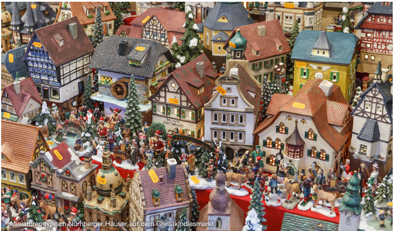
Miniaturen typisch Nürnberger Häuser auf dem Christkindlesmarkt

räume hat das BVerfG den Gesetzgeber verpflichtet, eine verfassungsgemäße Neuregelung zu treffen. Das Landesamt für Steuern Niedersachsen (LStN) hat sich bereits im September zu den Konsequenzen dieser Rechtsprechung geäußert (aktuell bestätigt durch BMF-Schreiben vom 29.11.2021).