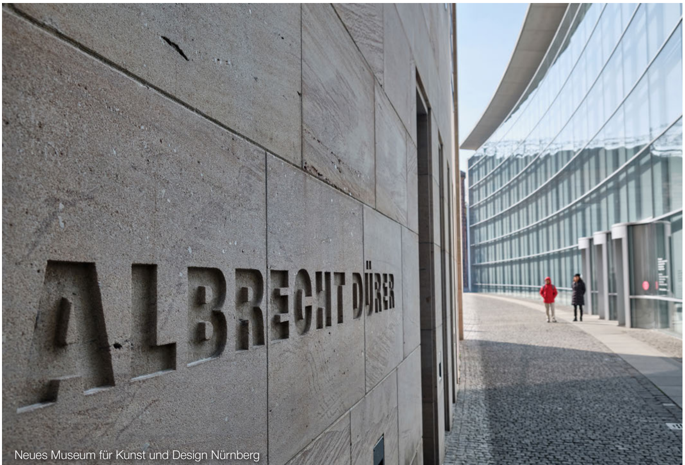
Neues Museum für Kunst und Design Nürnberg

Gesellschaft erfolgt, wird eine siebenjährige Behaltefrist nach § 22 Abs. 1 bzw. Abs. 2 UmwStG in Gang gesetzt, innerhalb derer eine Veräußerung der Anteile an der Gesellschaft (bzw. die Verwirklichung bestimmter Ersatzrealisationstatbestände) eine nachträgliche Versteuerung der stillen Reserven auslöst. Der sog. „Einbringungsgewinn“ im Zeitpunkt der Option wird dabei für jedes vollendete Jahr um 1/7 abgeschmolzen.