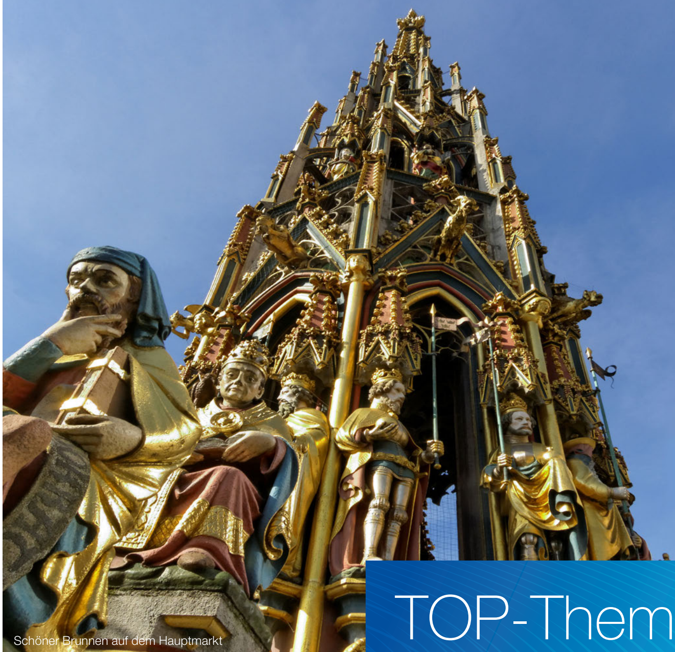
Schöner Brunnen auf dem Hauptmarkt