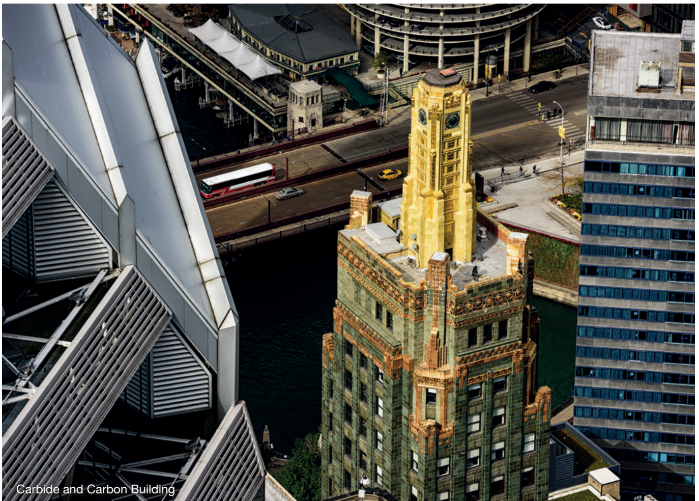
Carbide and Carbon Building