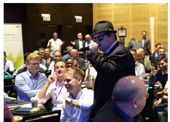
Don't miss the Blues Brothers.