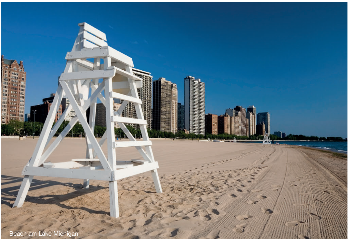
Beach am Lake Michigan

Wenn Pflichtteilsabwägungen keine Rolle spielen und bei der Schenkung eher die ggf. mehrfache Ausnutzung von Schenkungsteuerfreibeträgen im Vordergrund steht, kann ein vorbehaltenes Nutzungsrecht dagegen ein geeignetes Mittel sein, um den steuerlichen Wert der Bereicherung zu reduzieren. Hier gilt: Je früher man entsprechende Maßnahmen angeht, desto größer ist der steuerliche Effekt.