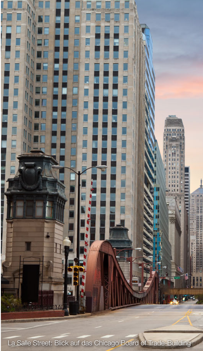
La Salle Street: Blick auf das Chicago Board of Trade-Building