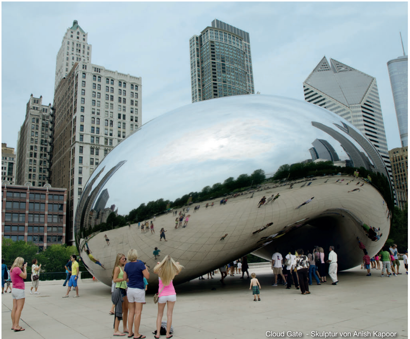
Cloud Gate - Skulptur von Anish Kapoor

Danach besteht kein Kindergeldanspruch mehr, wenn ein Kind nach einem dualen Studium zum Diplom-Finanzwirt mit mehr als 20 Wochenstunden beim Finanzamt arbeitet und währenddessen berufsbegleitend einem Studium der Rechtswissenschaften nachgeht. Zwar bestehe ein enger zeitlicher und sachlicher Zusammenhang zwischen den beiden Ausbildungsgängen, da das Studium unmittelbar nach Beendigung des dualen Studiums aufgenommen wurde und eine inhaltliche Nähe des dualen Studiums zu dem der Rechtswissenschaften vorliegt. Jedoch sei weitere Voraussetzung für eine Verklammerung zu einer einheitlichen Erstausbildung, dass das Ausbildungselement im zweiten Ausbildungsabschnitt die Haupttätigkeit des Kindes bildet und nicht hinter die Erwerbstätigkeit zurücktritt. Diese Voraussetzung schien zunächst erfüllt, weil die Studentin gleichhohe Zeiteile in Ausbildung und Erwerbstätigkeit investiert hatte und sich die Ausbildungszeiten nach den arbeitsfreien Zeiten richteten. Im Ergebnis wurde dennoch der Kindergeldanspruch aberkannt, weil die absolute 20-Stunden-Grenze überschritten wurde.